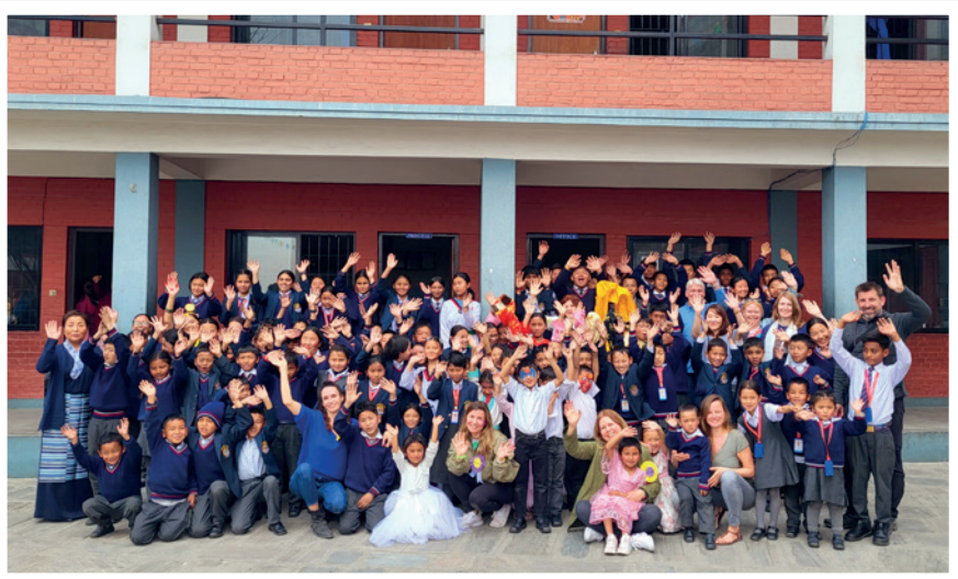
▲ Die Patenfamilie

Besonders beeindruckt hat uns auch die Großzügigkeit der Paten, ihre Herzlichkeit und ihr Engagement für die Kinder. Gemeinsam haben wir unvergessliche Erlebnisse geteilt – ob beim