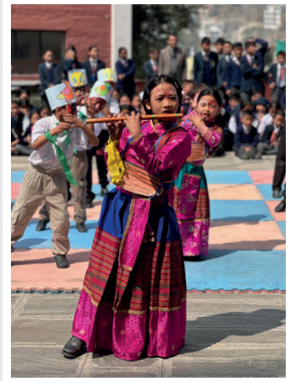
Aufführung für die Paten

Die Reise mit dem Verein Schoolkids Kopan war denkbar einfach, schön und herzergreifend. Wir werden gebeten, so viele Schulsachen wie möglich in unsere Koffer zu