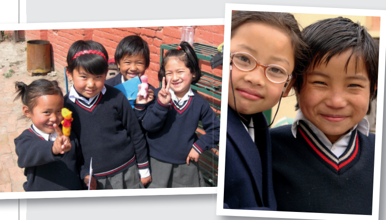
Schülerinnen und Schüler der MGA ▶

HINWEIS: Die Mitglieder von Schoolkids Kopan e.V. finanzieren ihre Reisen nach Nepal sowie den dortigen Aufenthalt privat.