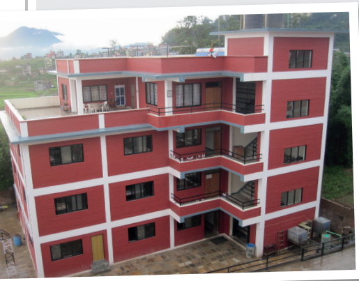
◀ Die MGA im Stadtteil Kopan

Die MGA finanziert sich vollumfänglich durch Spenden und Schulgebühren, die wenn möglich von den Eltern selbst bezahlt, ansonsten durch Patenschaften finanziert werden. Da sie eine private Institution ist, erhält sie von der nepalesischen Regierung keine Unterstützung.